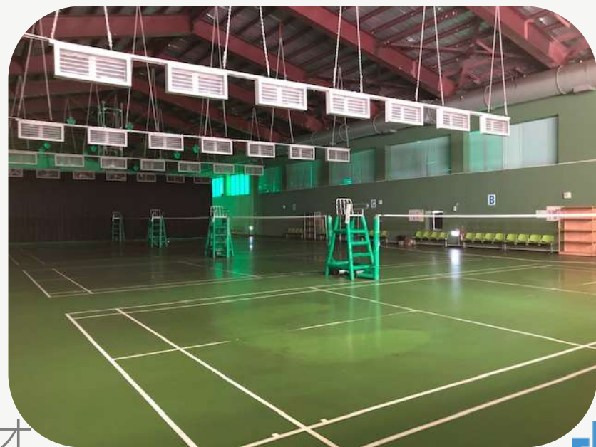
羽球場 排球場 籃球場